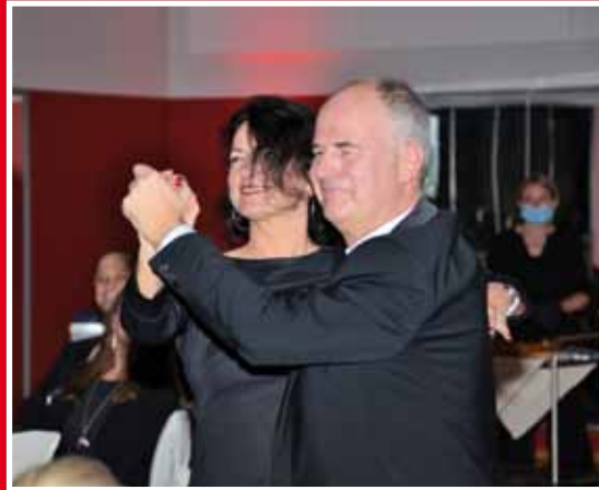
Hier tanzt das „Prinzenpaar“ noch einmal „seinen“ Tango