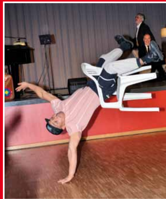
Das reit das Publikum fast von den Sthlen