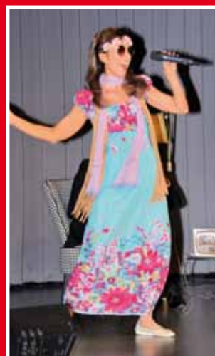
Flower Power in den 70ern