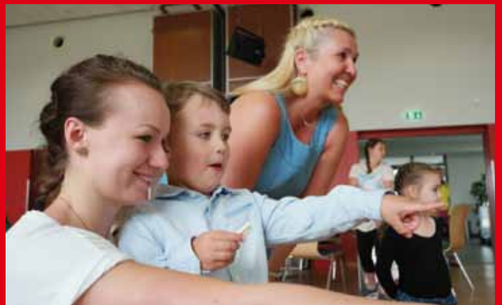
Für den Weihnachtsball 2019 wurde in allen Tanzgruppen eine Francaise einstudiert - ein tolles Erlebnis!