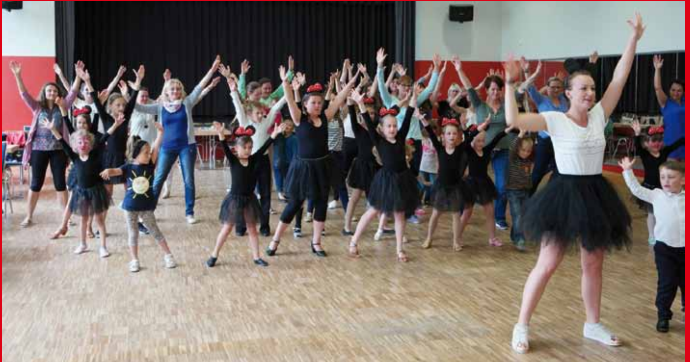
2017 Sommerparty in Nauborn