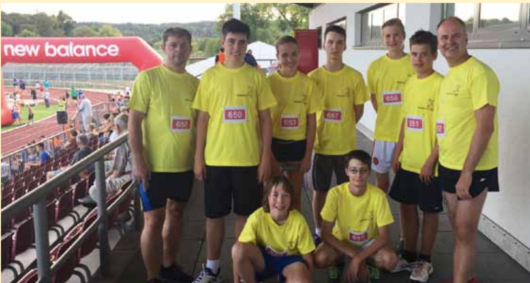
2. September: Wetzlarer Brückenlauf 2016 Mit dabei das „Dream-Team“: 1. und 2. Vorsitzender