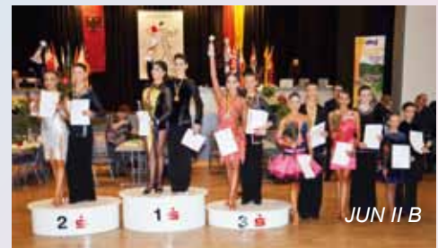
JUN II B