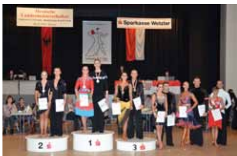
Hauptgruppe A Latein