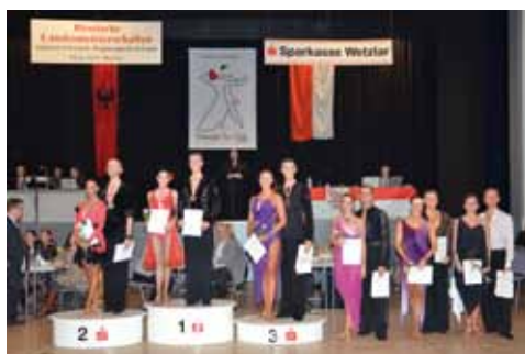
Hauptgruppe B Latein