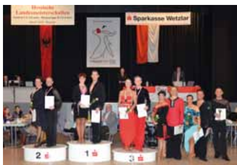
Senioren S Latein