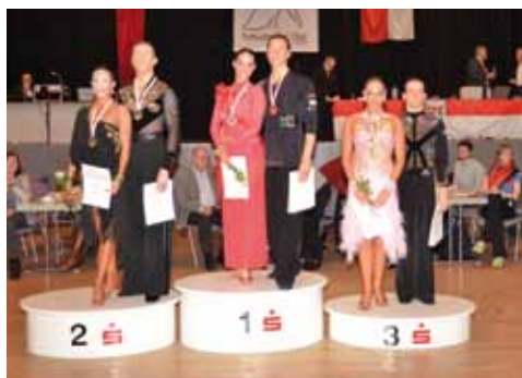
Hauptgruppe S Latein