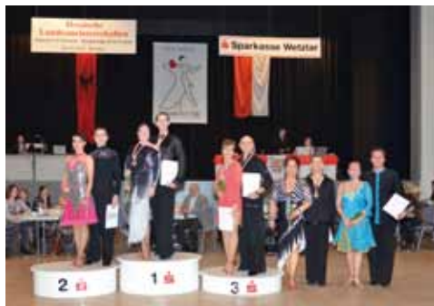
Senioren A Latein